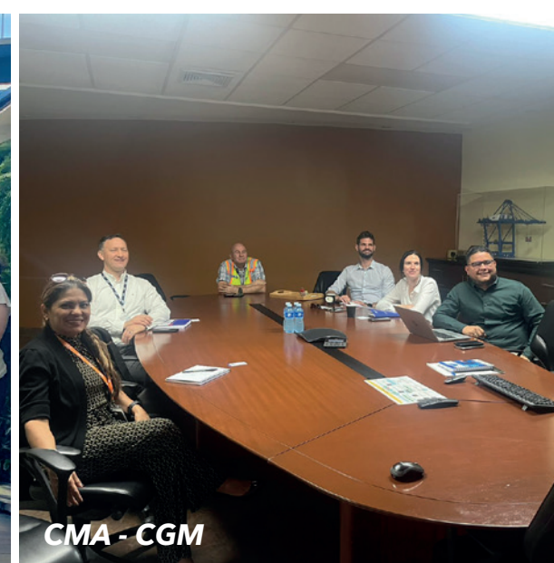
CMA - CGM