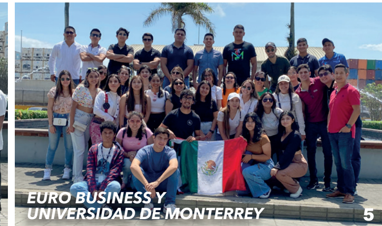
EURO BUSINESS Y UNIVERSIDAD DE MONTERREY