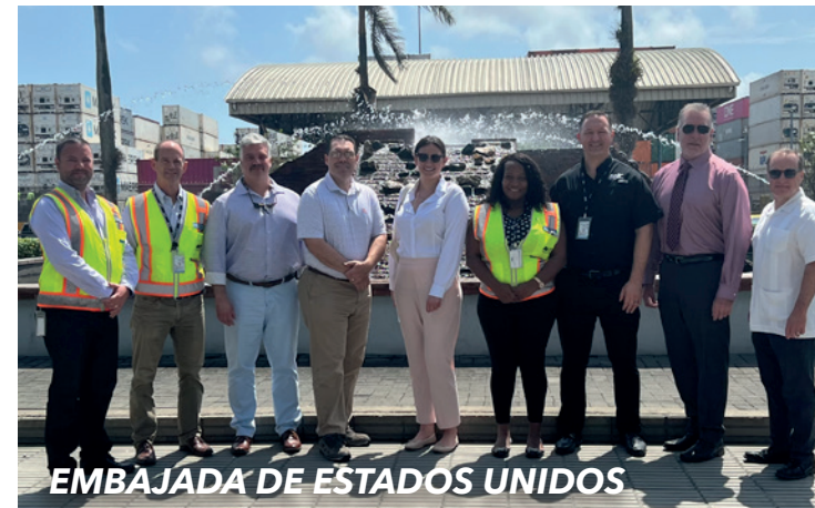
EMBAJADA DE ESTADOS UNIDOS