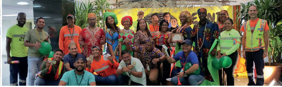
"Todos debemos saber que la diversidad es un bonito tapiz, y debemos entender que todos los hilos del tapiz tienen el mismo valor, sin importar su color". Maya Angelou (1928-2014), escritora y poeta estadounidense que luchó contra la discriminación racial y el sexismo a través de su trabajo literario y activismo.