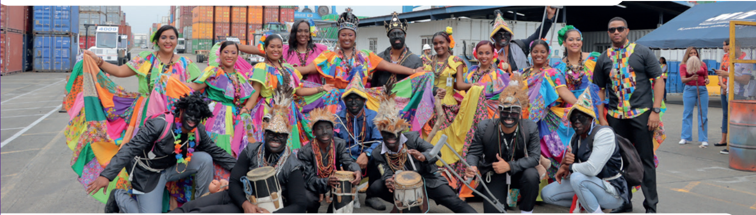
El conjunto de Proyecciones Folklóricas MIT, el Grupo Generación Costeña y Los Negros Congos de Colón nos trasladaron a recordar y sentir nuestra historia y cultura con presentaciones del baile congo, realizado en diferentes puntos de nuestra terminal. Esta danza es una mezcla de movimientos, percusión, sonidos fuertes, colores, vestidos y cantos, son una muestra ferviente de nuestras antiguas raíces africanas que se han venido transmitiendo de generación en generación.