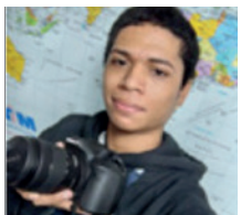
Richard Pascual Fotografía Departamento de Mercadeo