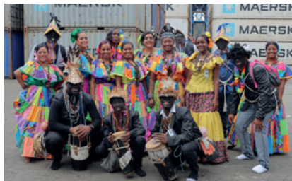
ETNIA NEGRA EN MIT