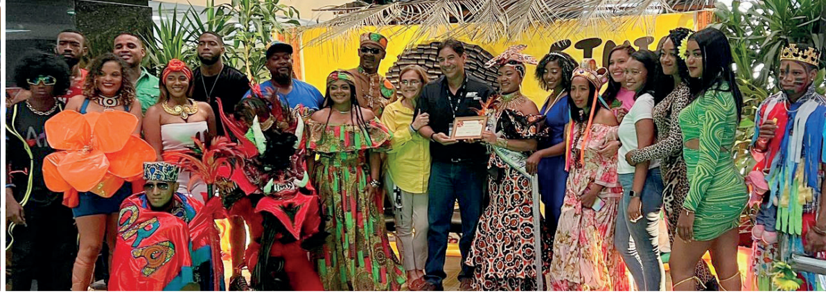
Fabuloso convivio interdepartamental de Moda y Pasarela Étnica Negroide se llevó a cabo con mucho júbilo y vistosidad. Se recordaron y resaltaron los logros y grandes aportes que nos han legado los negros en la historia de la humanidad, nacional y mundialmente.